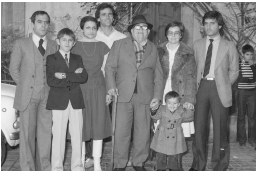
Il poeta nel luglio del 1981 circondato da figli e nipoti. Ultime immagini.