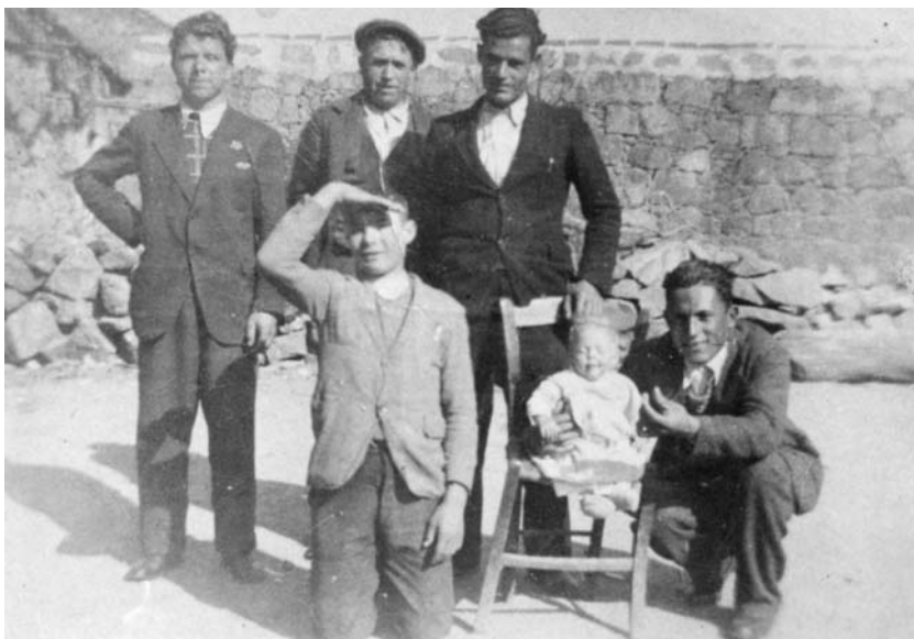
Il poeta (2° da sin.) con amici. Anni '60.