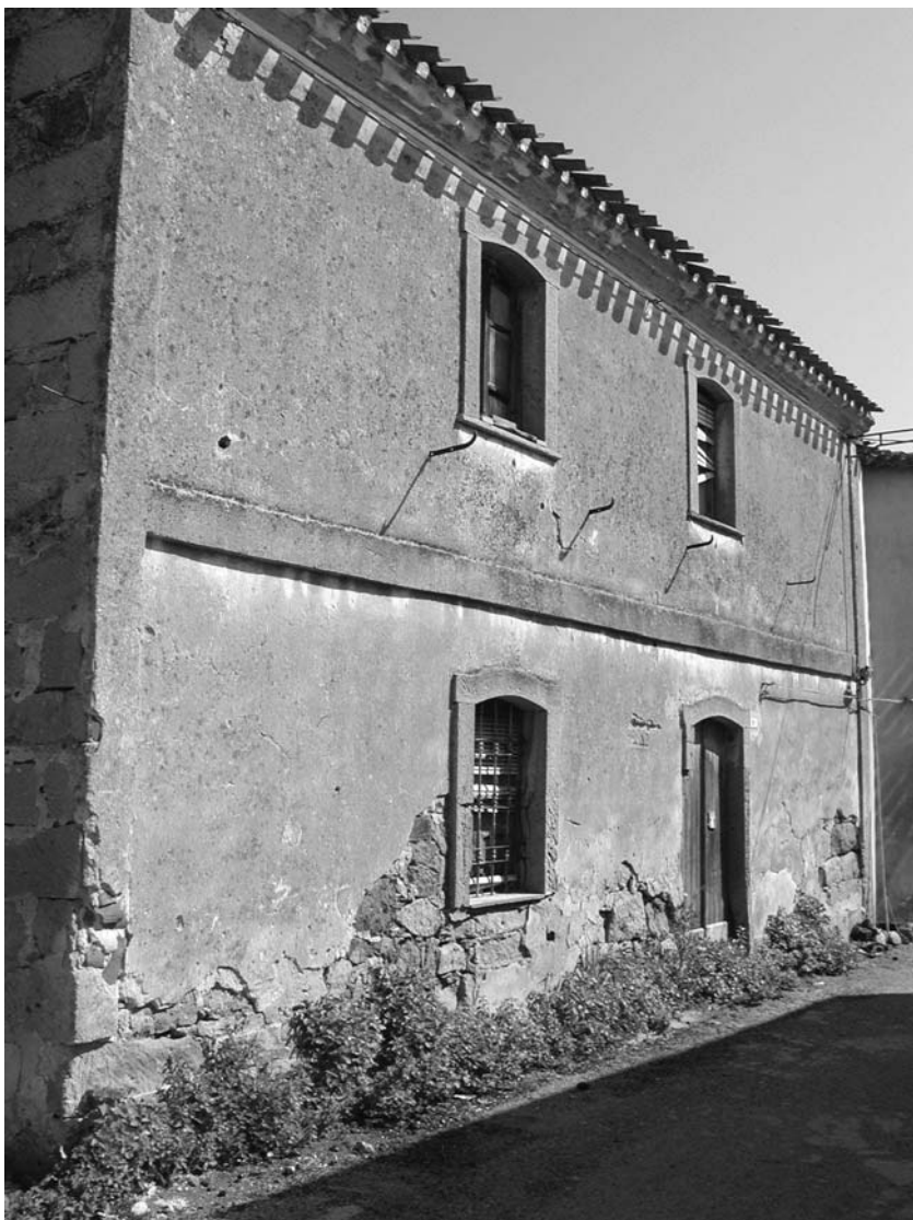
Casa di Via Lamarmora, dove il poeta si trasferì intorno al 1924, dopo aver ristrutturato quella che era una casetta in rovina di proprietà della moglie.