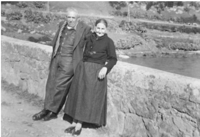
Il poeta e la moglie.