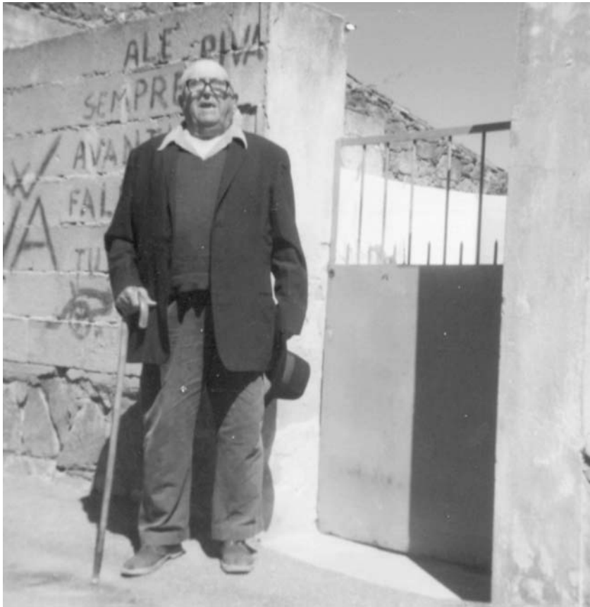
Il poeta anziano.