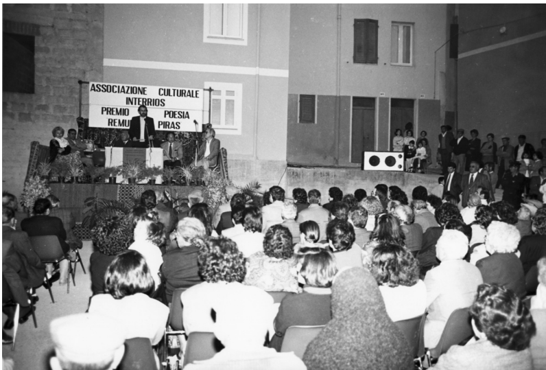
Festa de su cuncursu "Remundu Piras" (1991).