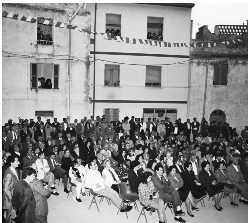
Sa festa de su cuncursu de poesia "Remundu Piras" de su 1991.