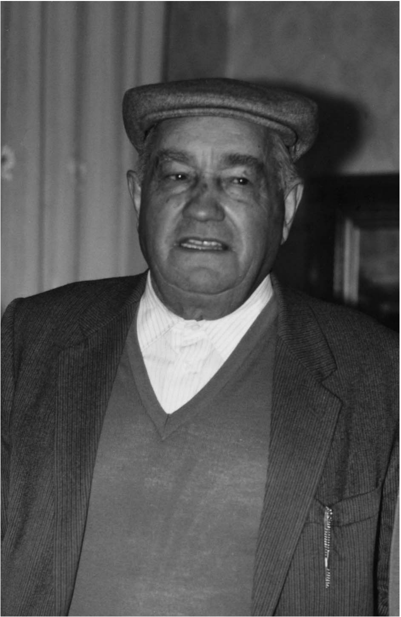
Peppe Sozu a dies de oe.